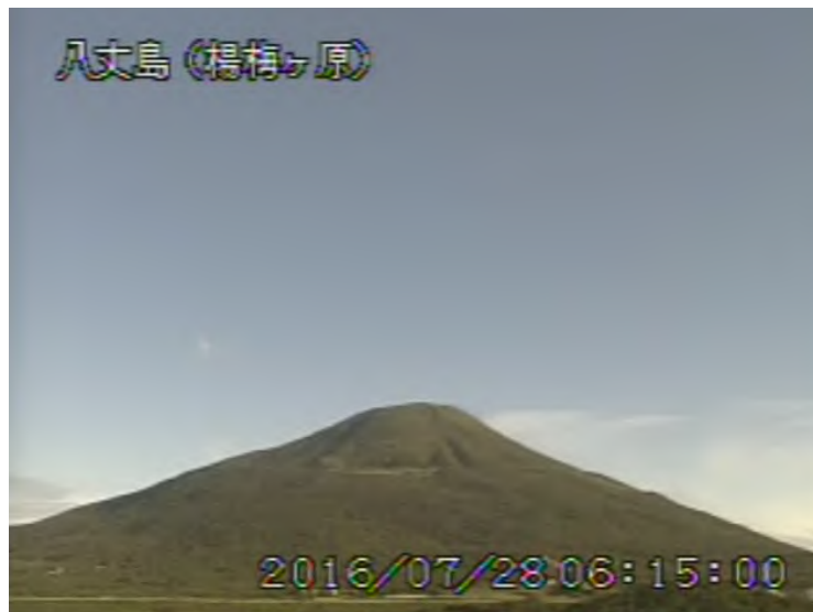
図 1 八丈島 西山山頂部の状況 (7月28日 楊梅ヶ原 ようめがはら 遠望カメラによる)

1) GNSS (Global Navigation Satellite Systems) とは、GPS をはじめとする衛星測位システム全般を示す呼称です。