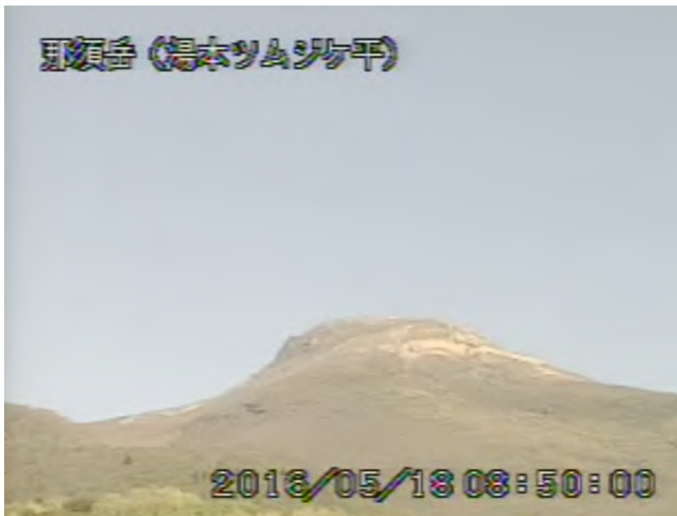
図 1 那須岳 茶臼岳の状況（5 月 18 日、那須湯本ツムジケ平遠望カメラによる）

1) GNSS (Global Navigation Satellite Systems) とは、GPSをはじめとする衛星測位システム全般を示す呼称です。