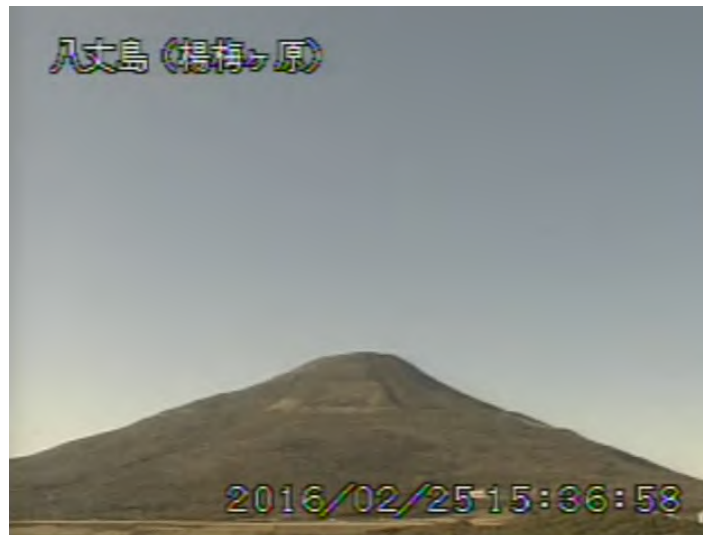
図 1 八丈島 西山山頂部の状況 （2月25日 楊梅ヶ原 ようめがはら 遠望カメラによる）

注）GNSS（Global Navigation Satellite Systems）とは、GPSをはじめとする衛星測位システム全般を示す呼称です。