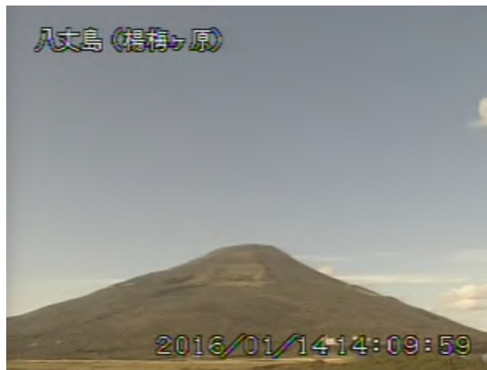
図 1 八丈島 西山山頂部の状況 （1月14日 楊梅ヶ原 ようめがはら 遠望カメラによる）

注）GNSS（Global Navigation Satellite Systems）とは、GPSをはじめとする衛星測位システム全般を示す呼称です。