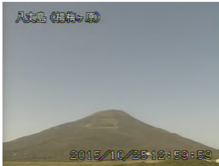
図 1 八丈島 西山山頂部の状況 （10月25日 楊梅ヶ原 ようめがはら 遠望カメラによる）

注）GNSS（Global Navigation Satellite Systems）とは、GPSをはじめとする衛星測位システム全般を示す呼称です。