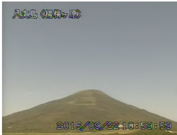
図 1 八丈島 西山山頂部の状況 （9月22日 楊梅ヶ原 ようめがはら 遠望カメラによる）

注）GNSS（Global Navigation Satellite Systems）とは、GPSをはじめとする衛星測位システム全般を示す呼称です。