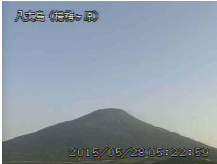
図 1 八丈島 西山山頂部の状況 （5月28日 楊梅ヶ原 ようめがはら 遠望カメラによる）

注）GNSS（Global Navigation Satellite Systems）とは、GPSをはじめとする衛星測位システム全般を示す呼称です。