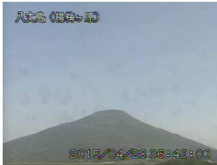
図 1 八丈島 西山山頂部の状況 （4月28日 楊梅ヶ原 ようめがはら 遠望カメラによる）

注）GNSS（Global Navigation Satellite Systems）とは、GPSをはじめとする衛星測位システム全般を示す呼称です。