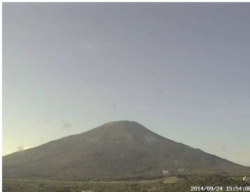
図 1 八丈島 西山山頂部の状況 （9月24日 楊梅ヶ原遠望カメラによる）

注）GNSS（Global Navigation Satellite Systems）とは、GPSをはじめとする衛星測位システム全般を示す呼称です。