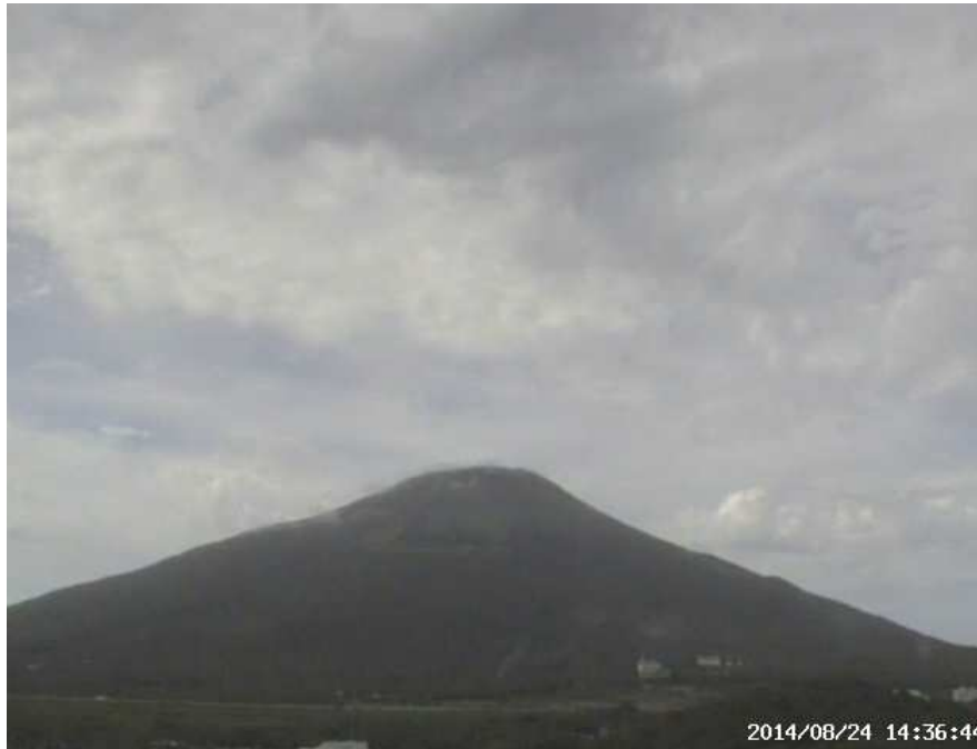
図 1 八丈島 西山山頂部の状況 （8月24日 楊梅ヶ原遠望カメラによる）

注）GNSS（Global Navigation Satellite Systems）とは、GPSをはじめとする衛星測位システム全般を示す呼称です。