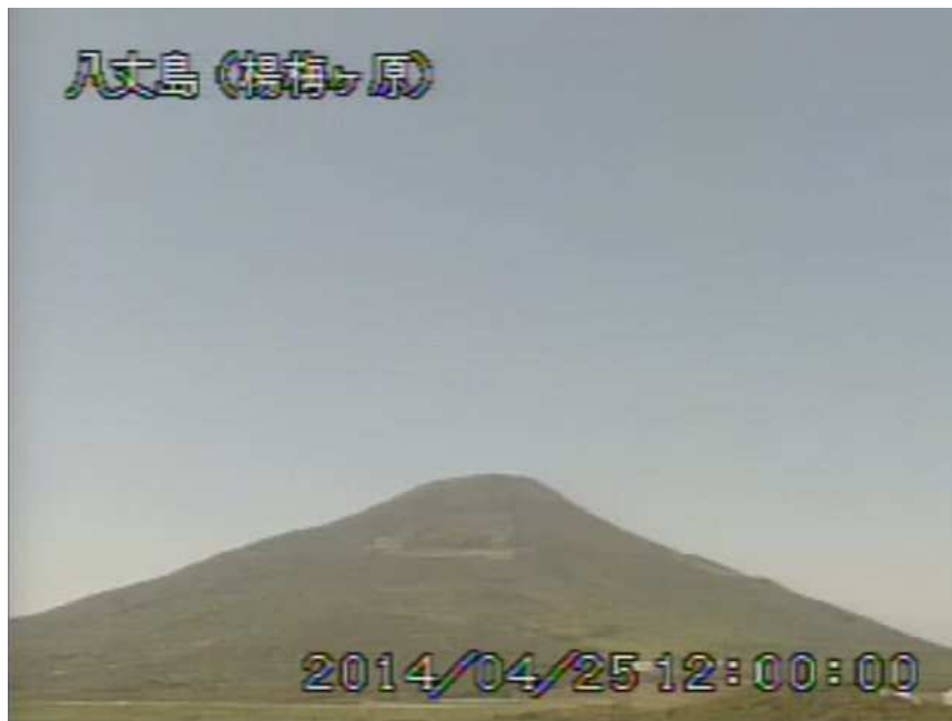
図 1 八丈島 西山山頂部の状況 （4月25日 楊梅ヶ原遠望カメラによる）

注）GNSS（Global Navigation Satellite Systems）とは、GPSをはじめとする衛星測位システム全般を示す呼称です。