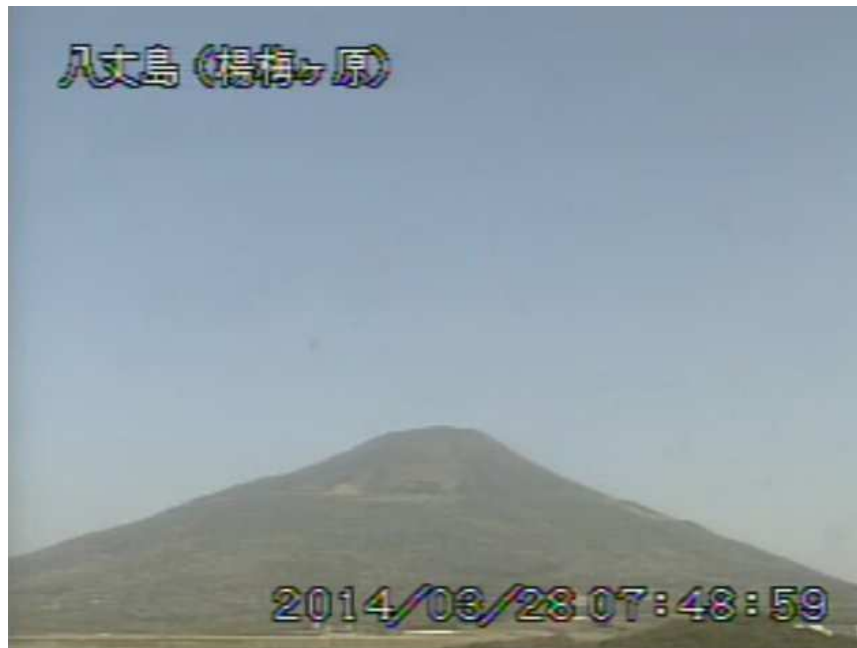
図1 八丈島 西山山頂部の状況 (3月28日 楊梅ヶ原遠望カメラによる)

この火山活動解説資料は気象庁ホームページ( http://www.data.jma.go.jp/svd/vois/data/tokyo/volcano.html )でも閲覧することができます。次回の火山活動解説資料(平成26年4月分)は平成26年5月12日に発表する予定です。