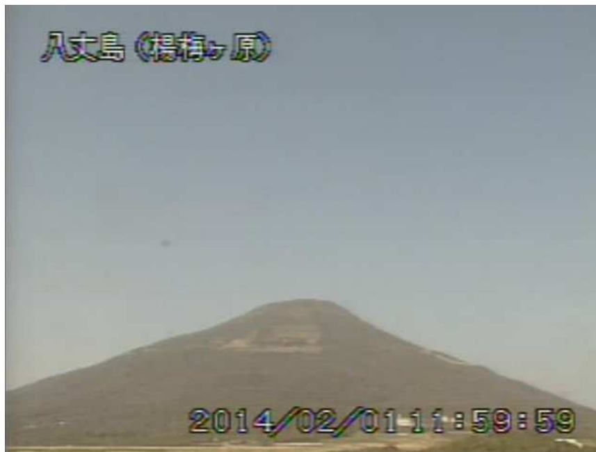
図 1 八丈島 西山山頂部の状況 （2月1日 楊梅ヶ原遠望カメラによる）

この火山活動解説資料は気象庁ホームページ（ http://www.seisvol.kishou.go.jp/tokyo/volcano.html ）でも閲覧することができます。次回の火山活動解説資料（平成 26 年 3 月分）は平成 26 年 4 月 8 日に発表する予定です。