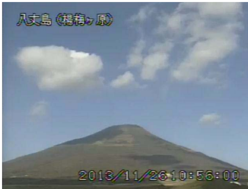
図 1 八丈島 西山山頂部の状況 (11 月 26 日 楊梅ヶ原遠望カメラによる)

この火山活動解説資料は気象庁ホームページ ( http://www.seisvol.kishou.go.jp/tokyo/volcano.html ) でも閲覧することができます。次回の火山活動解説資料（平成 25 年 12 月分）は平成 26 年 1 月 14 日に発表する予定です。