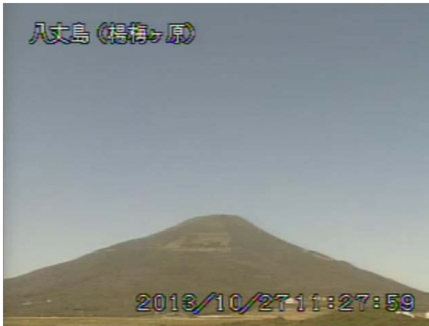
図 1 八丈島 西山山頂部の状況 (10 月 27 日 楊梅ヶ原遠望カメラによる)

この火山活動解説資料は気象庁ホームページ ( http://www.seisvol.kishou.go.jp/tokyo/volcano.html ) でも閲覧することができます。次回の火山活動解説資料（平成 25 年 11 月分）は平成 25 年 12 月 9 日に発表する予定です。