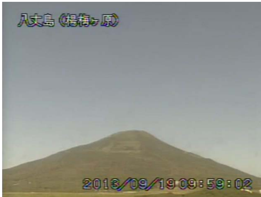
図 1 八丈島 西山山頂部の状況 （9月19日 楊梅ヶ原遠望カメラによる）

この火山活動解説資料は気象庁ホームページ（ http://www.seisvol.kishou.go.jp/tokyo/volcano.html ）でも閲覧することができます。次回の火山活動解説資料（平成 25 年 10 月分）は平成 25 年 11 月 11 日に発表する予定です。