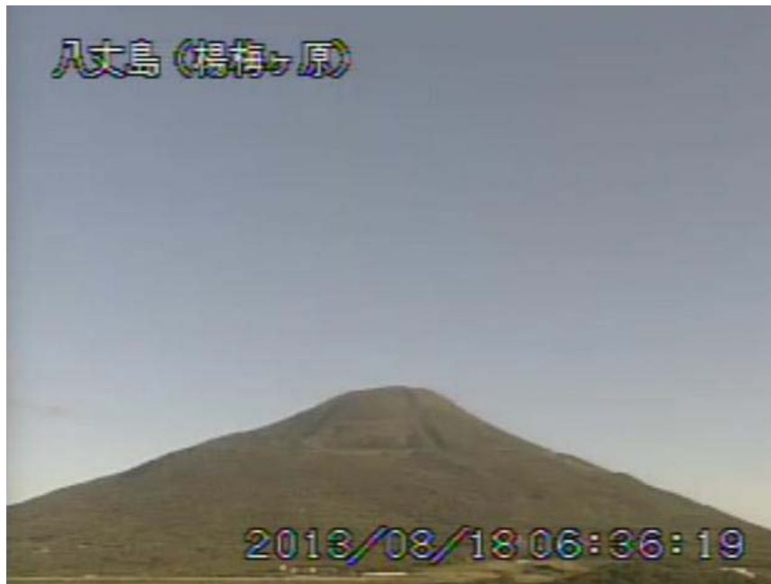
図 1 八丈島 西山山頂部の状況 (8月18日 楊梅ヶ原遠望カメラによる)

この火山活動解説資料は気象庁ホームページ ( http://www.seisvol.kishou.go.jp/tokyo/volcano.html ) でも閲覧することができます。次回の火山活動解説資料（平成 25 年 9 月分）は平成 25 年 10 月 9 日に発表する予定です。