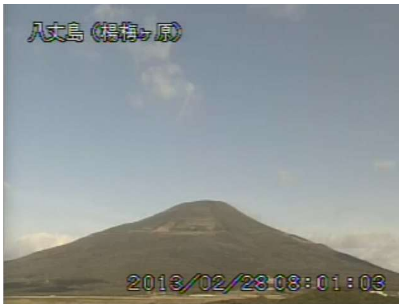
図 1 八丈島 西山山頂部の状況 （2月28日 楊梅ヶ原遠望カメラによる）

この火山活動解説資料は気象庁ホームページ（ http://www.seisvol.kishou.go.jp/tokyo/volcano.html ）でも閲覧することができます。次回の火山活動解説資料（平成 25 年 3 月分）は平成 25 年 4 月 8 日に発表する予定です。