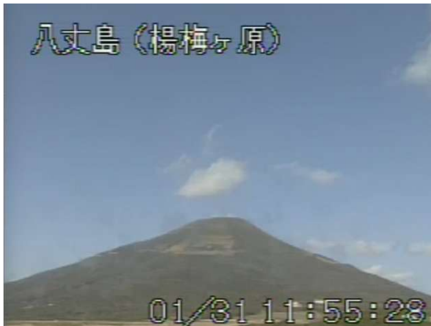
図 1 八丈島 西山山頂部の状況 （1月31日 楊梅ヶ原遠望カメラによる）

この火山活動解説資料は気象庁ホームページ（ http://www.seisvol.kishou.go.jp/tokyo/volcano.html ）でも閲覧することができます。次回の火山活動解説資料（平成 25 年 2 月分）は平成 25 年 3 月 8 日に発表する予定です。