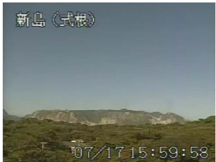
図 2 新島 丹後山山頂部の状況 (7月17日、式根遠望カメラによる)