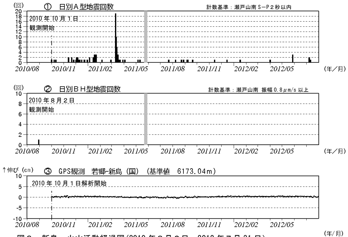
図3 新島 火山活動経過図(2010年8月2日~2012年7月31日)