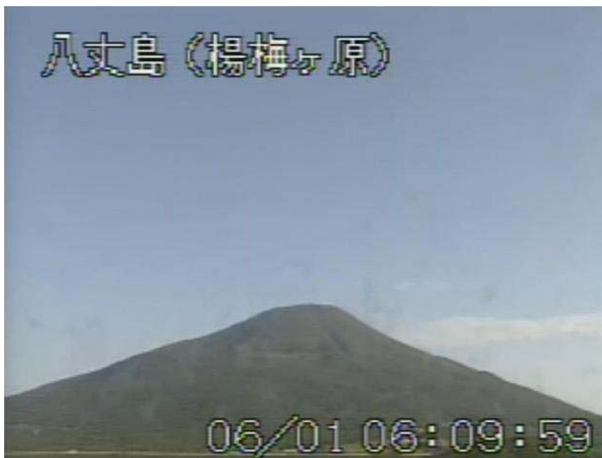
図 1 八丈島 山頂部の状況 （6 月 1 日 楊梅ヶ原遠望カメラによる）

この火山活動解説資料は気象庁ホームページ（ http://www.seisvol.kishou.go.jp/tokyo/volcano.html ）でも閲覧することができます。次回の火山活動解説資料（平成 24 年 7 月分）は平成 24 年 8 月 7 日に発表する予定です。