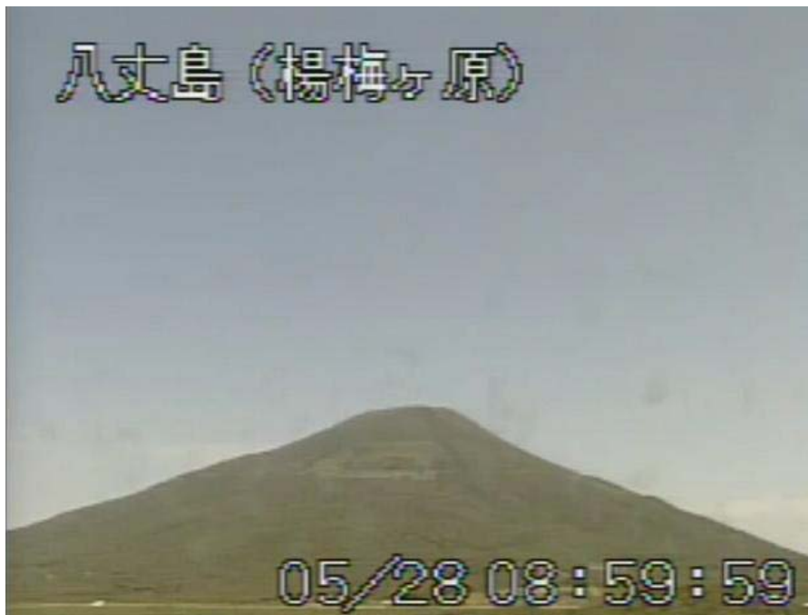
図 1 八丈島 山頂部の状況 （5 月 28 日 楊梅ヶ原遠望カメラによる）

この火山活動解説資料は気象庁ホームページ（ http://www.seisvol.kishou.go.jp/tokyo/volcano.html ）でも閲覧することができます。次回の火山活動解説資料（平成 24 年 6 月分）は平成 24 年 7 月 9 日に発表する予定です。