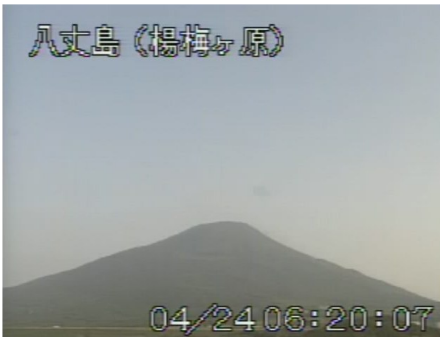
図 1 八丈島 山頂部の状況 (4月24日 楊梅ヶ原遠望カメラによる)

この火山活動解説資料は気象庁ホームページ ( http://www.seisvol.kishou.go.jp/tokyo/volcano.html ) でも閲覧することができます。次回の火山活動解説資料（平成 24 年 5 月分）は平成 24 年 6 月 8 日に発表する予定です。