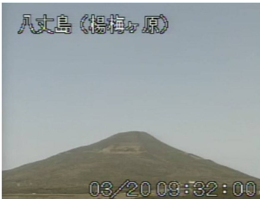
図 1 八丈島 山頂部の状況 (3月20日 楊梅ヶ原遠望カメラによる)

この火山活動解説資料は気象庁ホームページ ( http://www.seisvol.kishou.go.jp/tokyo/volcano.html ) でも閲覧することができます。次回の火山活動解説資料（平成 24 年 4 月分）は平成 24 年 5 月 10 日に発表する予定です。