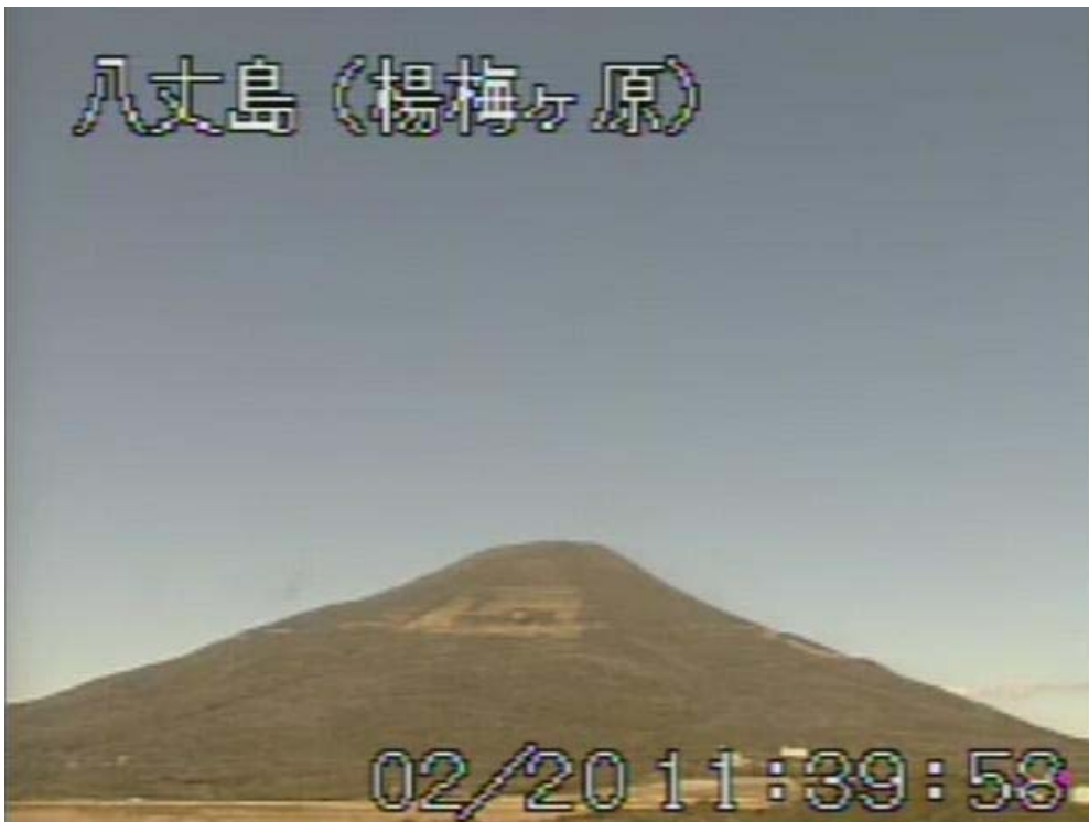
図 1 八丈島 山頂部の状況 （2月20日 楊梅ヶ原 ようめがはら 遠望カメラによる）

この火山活動解説資料は気象庁ホームページ（ http://www.seisvol.kishou.go.jp/tokyo/volcano.html ）でも閲覧することができます。次回の火山活動解説資料（平成 24 年 3 月分）は平成 24 年 4 月 9 日に発表する予定です。