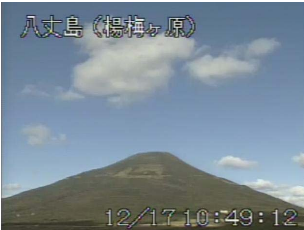
図 1 八丈島 山頂部の状況 (12 月 17 日 楊梅ヶ原遠望カメラによる)

八丈島付近を震源とする火山性地震の発生回数は少なく、地震活動は静穏に経過しました。 火山性微動は観測されませんでした。