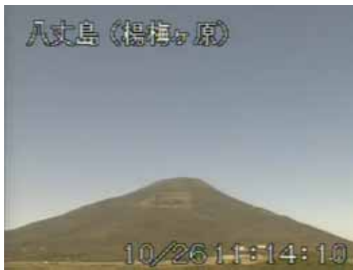
図 1 八丈島 山頂部の状況 (10月26日 楊梅ヶ原遠望カメラによる)

八丈島付近を震源とする火山性地震は観測されず、地震活動は静穏に経過しました。 火山性微動は観測されませんでした。