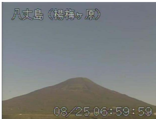
図 1 八丈島 山頂部の状況 (8月25日 楊梅ヶ原遠望カメラによる)