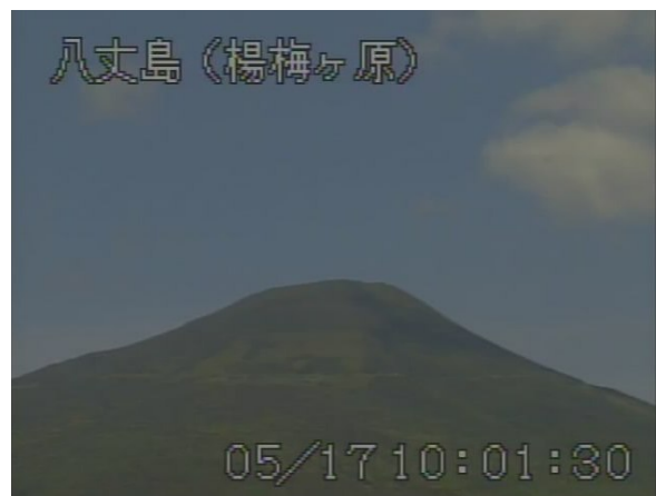
図 2 八丈島 山頂部の状況 (5月17日 楊梅ヶ原カメラによる)