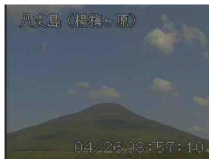
図 2 八丈島 山頂部の状況 (4 月 26 日 楊梅ヶ原カメラによる)