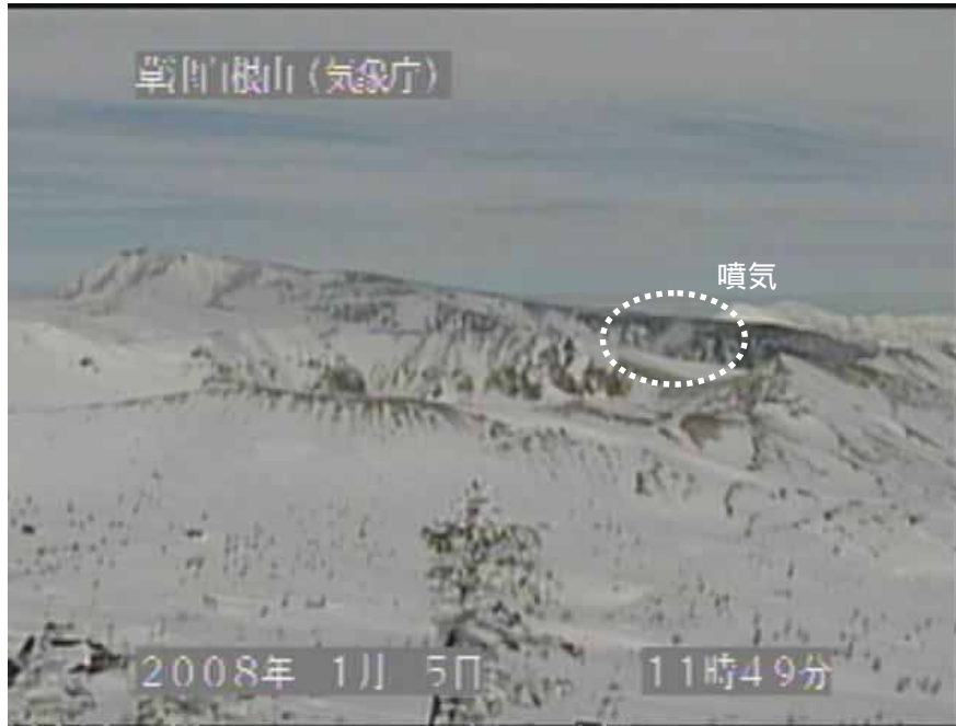
図2 草津白根山 湯釜付近の状況 (1月5日、逢ノ峰遠望カメラによる)