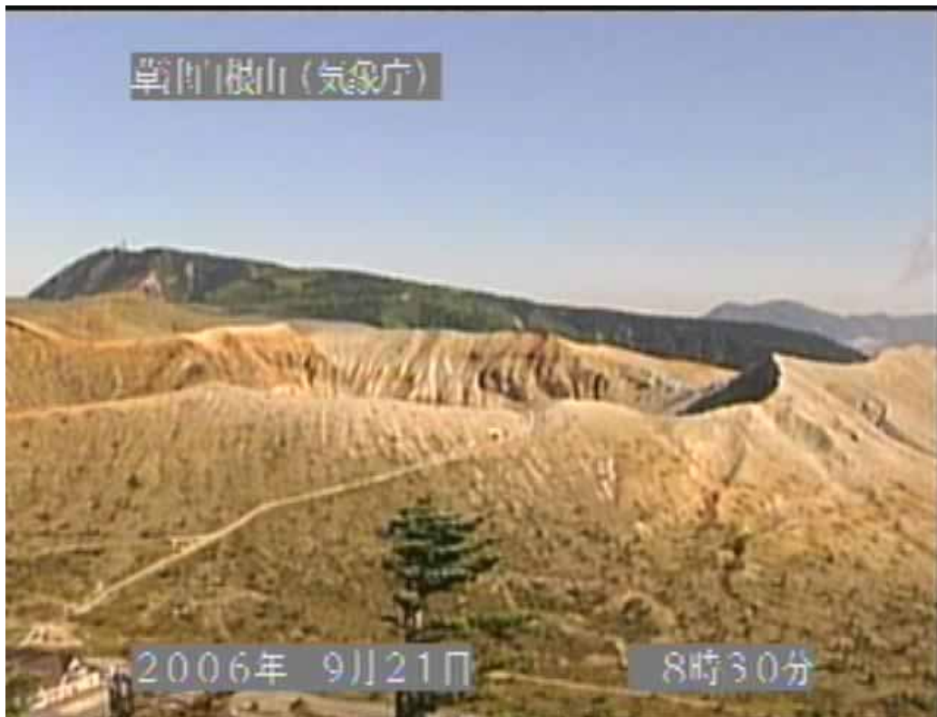
図1 草津白根山 湯釜付近の状況（9月21日、逢ノ峰遠望カメラによる）

逢ノ峰（湯釜の南約 1 km）に設置してある遠望カメラでは、湯釜火口縁を超える噴気は観測されませんでした。