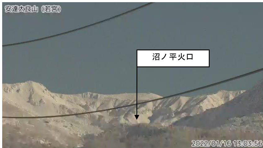
図1 安達太良山 沼ノ平火口周辺の状況（1月16日）