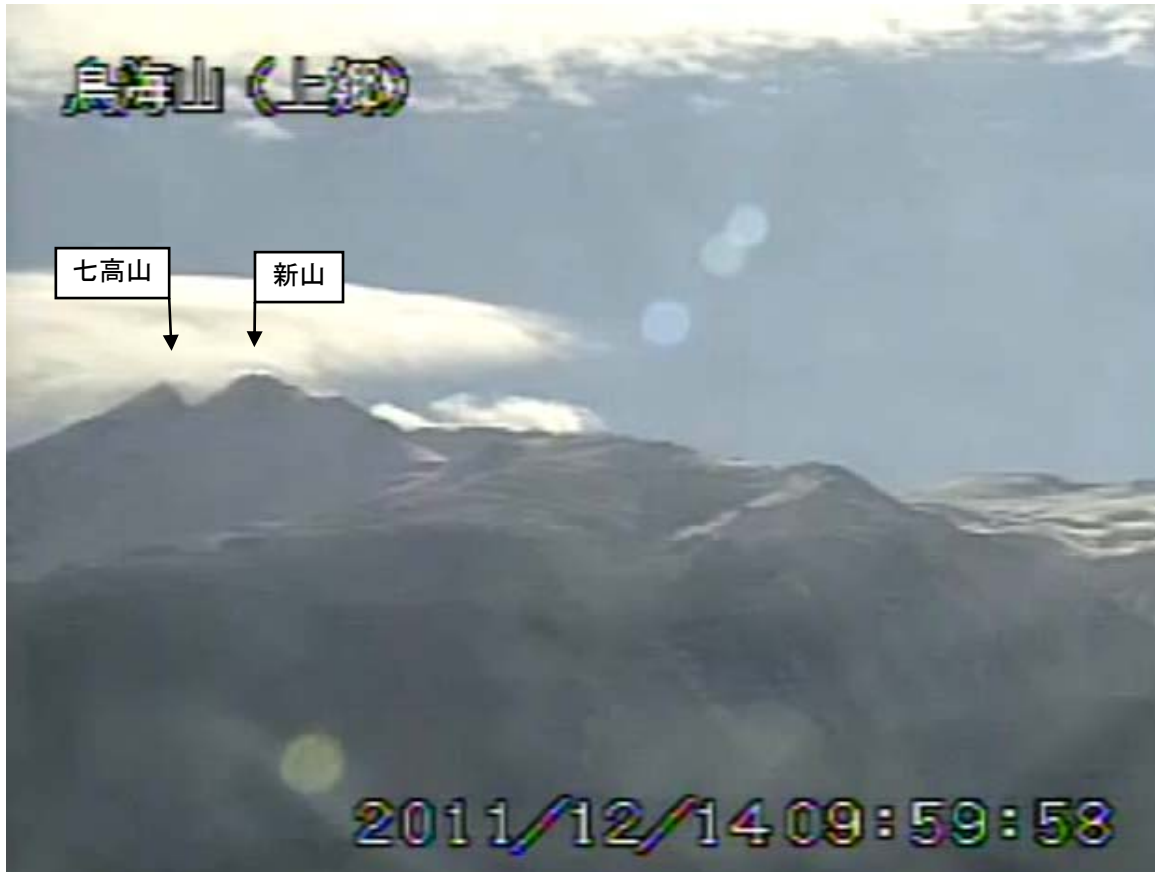
図2 鳥海山 遠望カメラの映像（12月14日10時00分頃） 上郷（山頂の北西約10km）に設置してある遠望カメラによる。