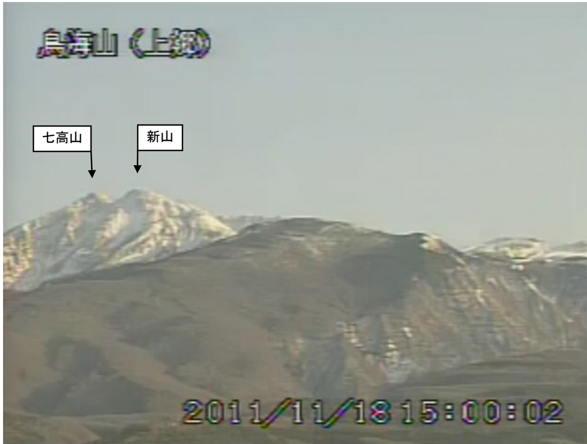
図2 鳥海山 遠望カメラの映像 (11月18日15時00分頃) 上郷 (山頂の北西約10km) に設置してある遠望カメラによる。