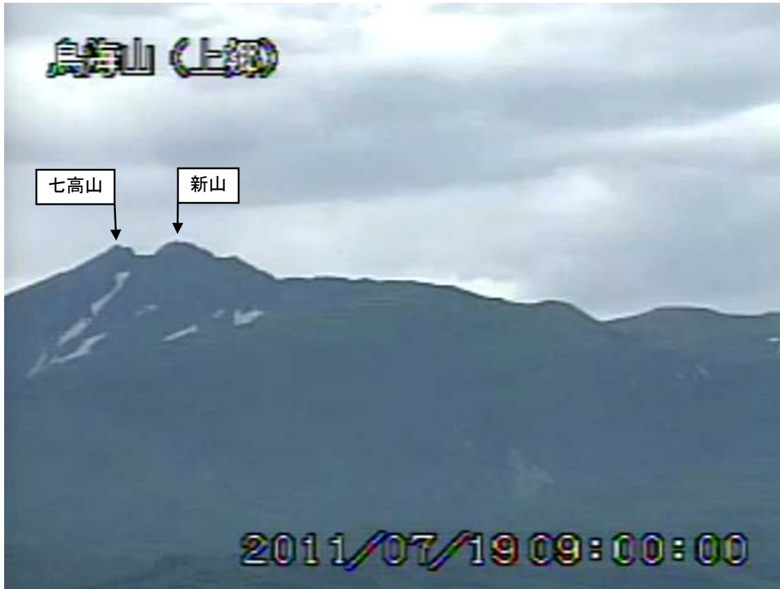
図2 鳥海山 遠望カメラの映像（7月19日09時00分頃） 上郷（山頂の北西約10km）に設置してある遠望カメラによる。