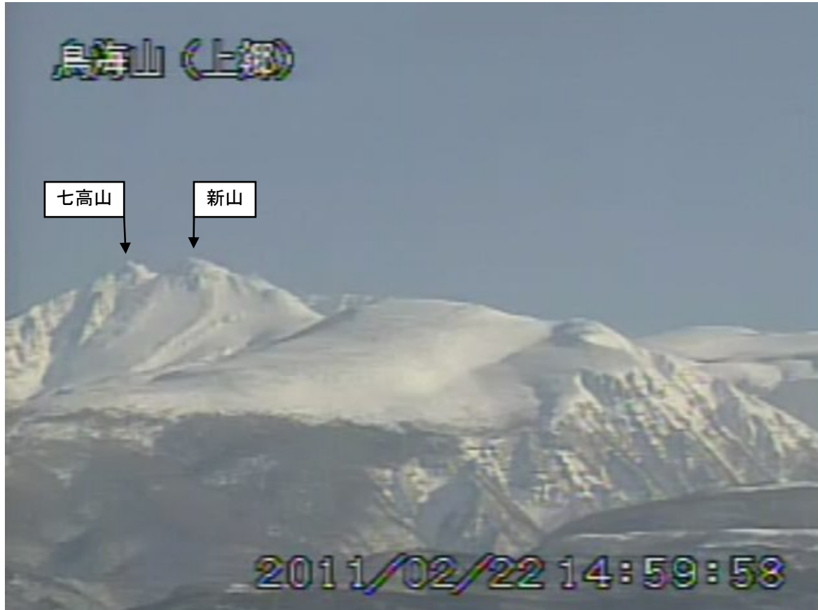
図2 鳥海山 遠望カメラの映像（2月22日15時00分頃） 上郷（山頂の北西約10km）に設置してある遠望カメラによる。