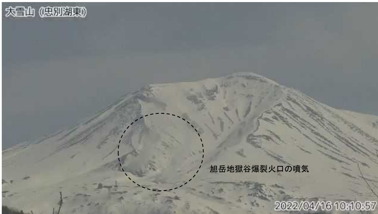
図2 大雪山 西側から見た旭岳の状況 (忠別湖東監視カメラによる)