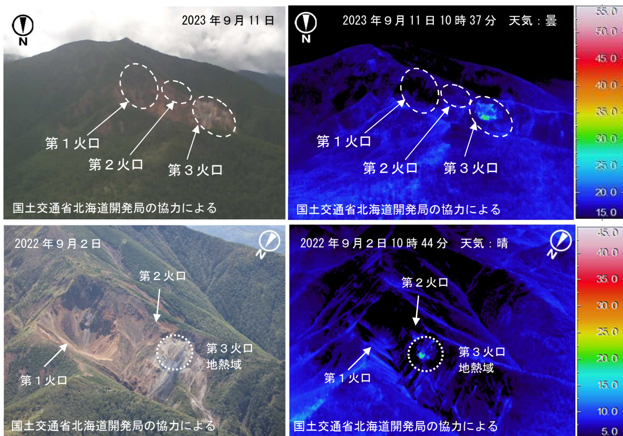
図3 丸山 赤外熱映像装置による第1火口～第3火口の地表面温度分布 上段：北側上空（図1の②）から撮影 下段：北西側上空（図1の③）から撮影 ・第3火口の地熱域（点線で囲まれた領域）の地表面温度分布は、前回の観測（2022年9月） と比べて特段の変化はありませんでした。