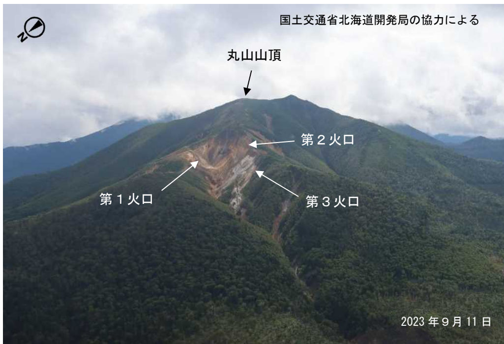
図2 丸山 北西斜面に位置する火口列の状況 北西側上空（図1の①）から撮影 ・第1火口～第3火口に噴気は認められませんでした。