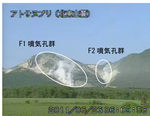
図 2 アトサヌプリ 山体北側の状況（6 月 26 日、北東山麓遠望カメラによる） 白丸内は F1 噴気孔群及び F2 噴気孔群からの噴気

この資料は札幌管区気象台のホームページ ( http://www.jma-net.go.jp/sapporo/ ) や気象庁のホームページ ( http://www.seisvol.kishou.go.jp/tokyo/volcano.html ) でも閲覧することができます。