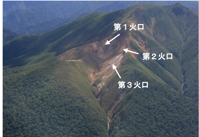
図 2 丸山 北西斜面火口列付近の状況 (2007年8月24日 図1 ①方向から撮影)