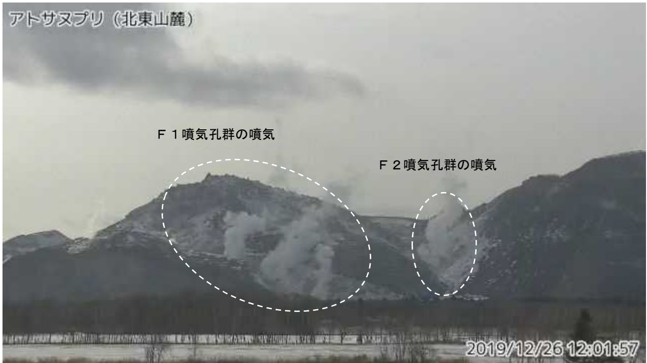
図2 アトサヌプリ 北東側から見た山体の状況 (12月26日、北東山麓監視カメラによる)