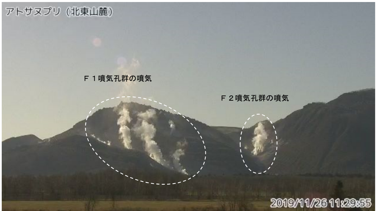
図2 アトサヌプリ 北東側から見た山体の状況 (11月26日、北東山麓監視カメラによる)