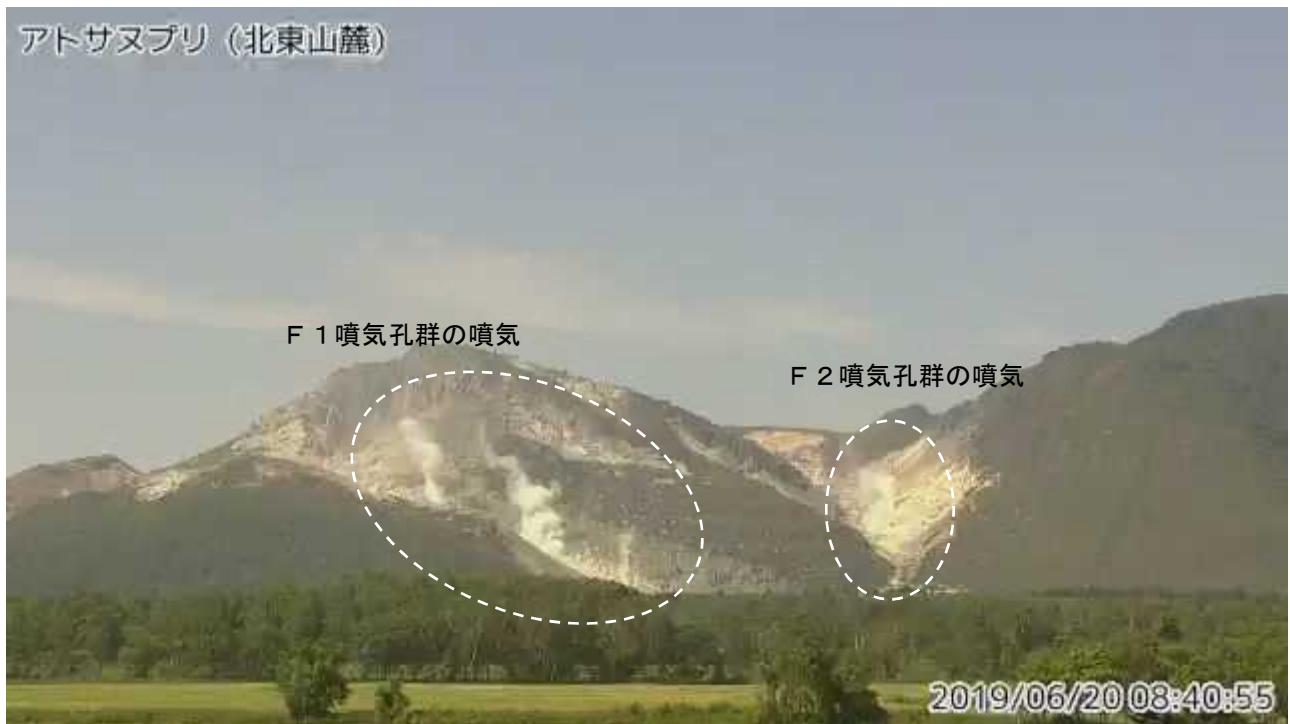
図2 アトサヌプリ 北東側から見た山体の状況 （6月20日、北東山麓監視カメラによる）