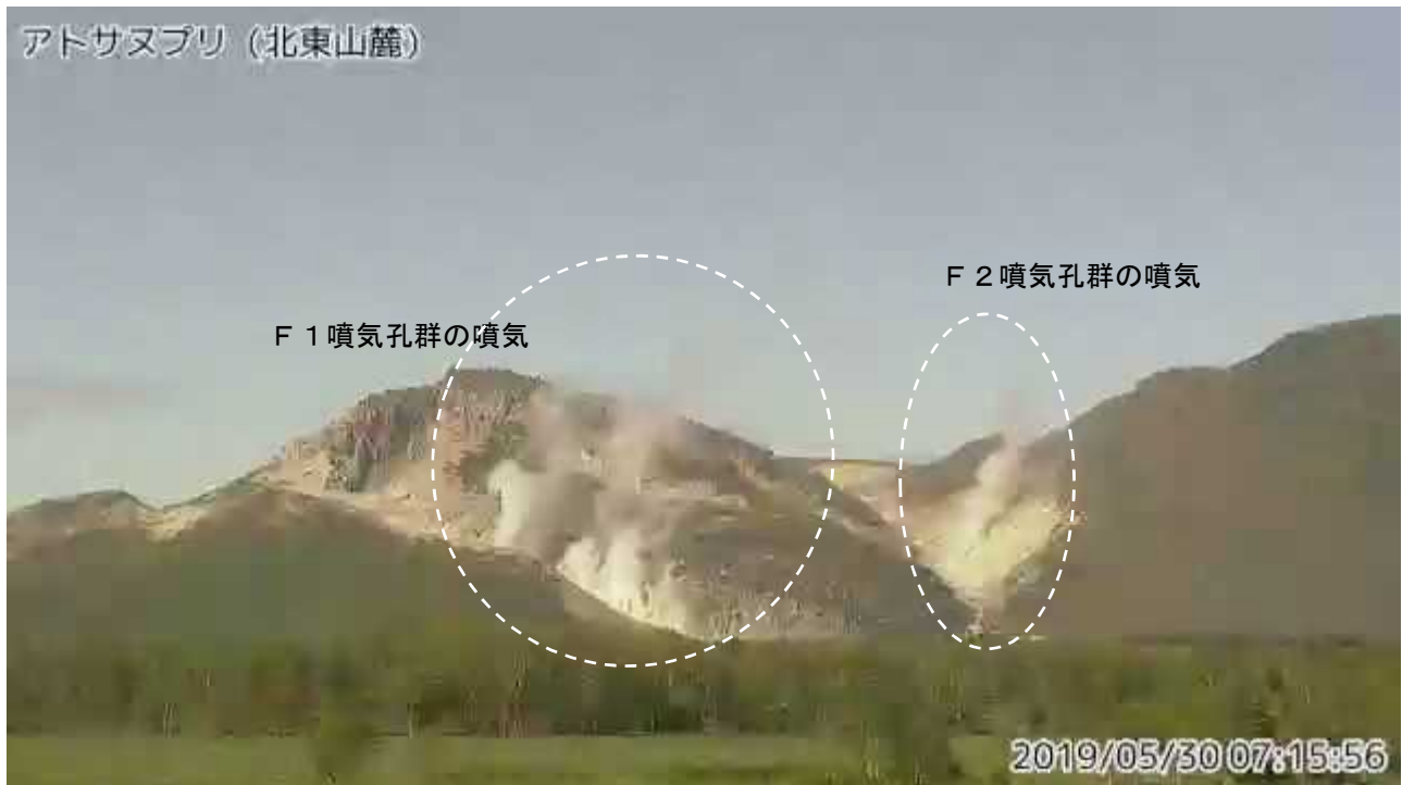
図2 アトサヌプリ 北東側から見た山体の状況 （5月30日、北東山麓監視カメラによる）