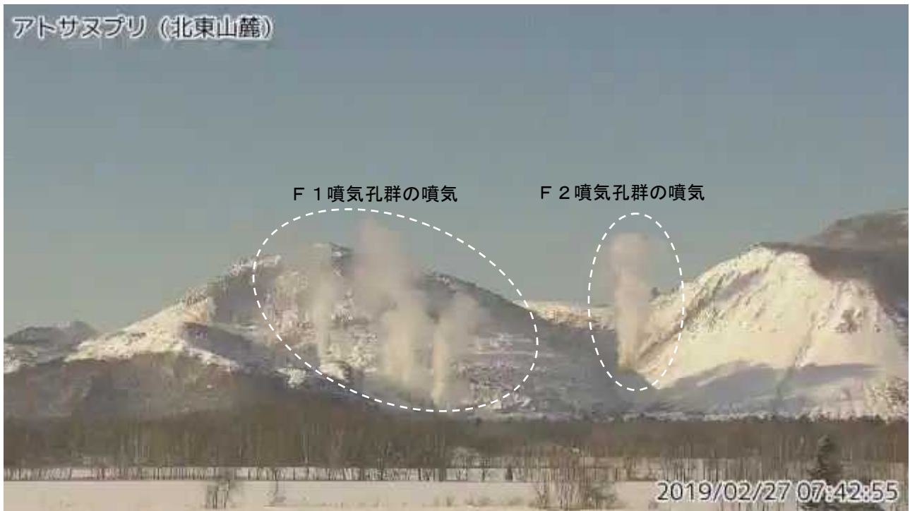
図2 アトサヌプリ 北東側から見た山体の状況 (2月27日、北東山麓監視カメラによる)