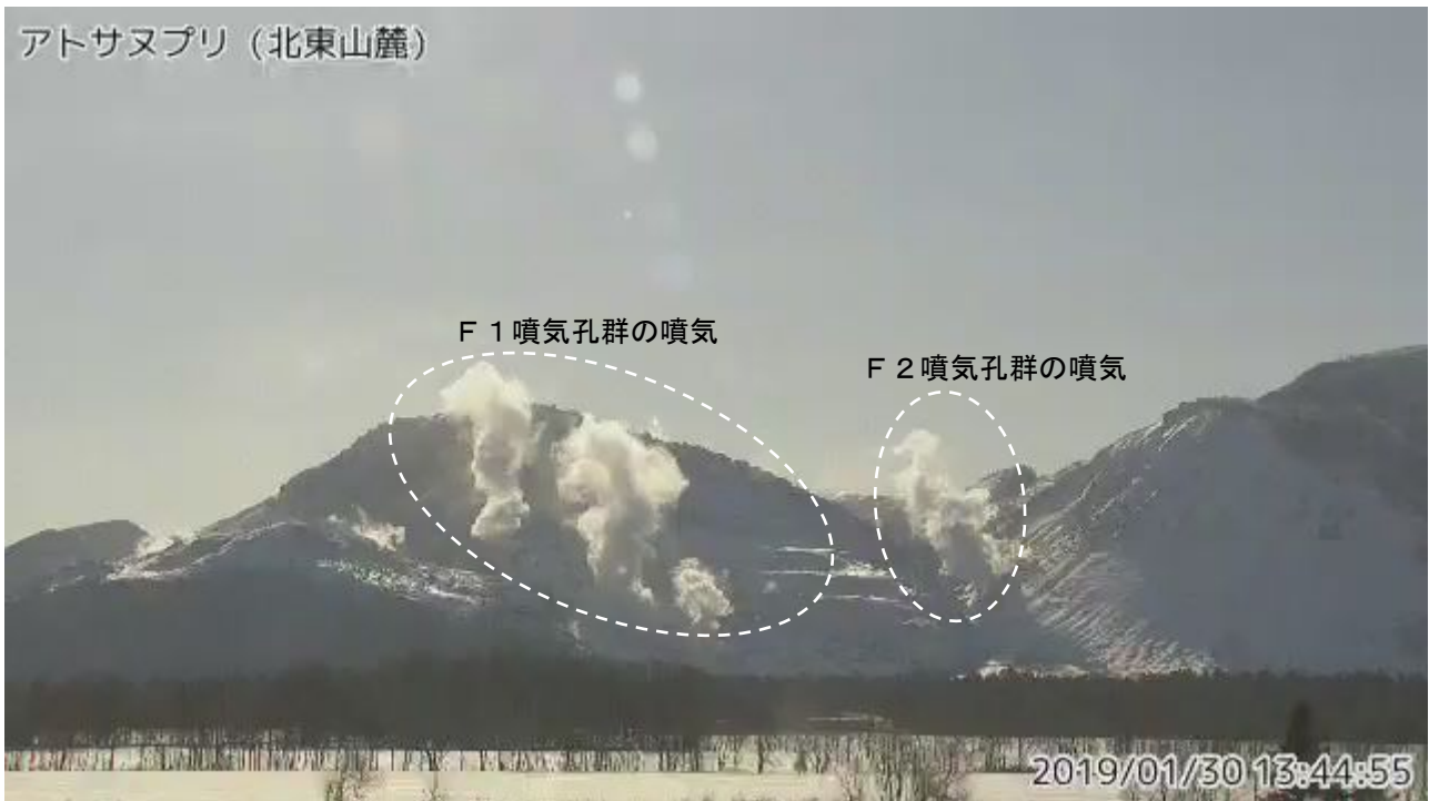
図2 アトサヌプリ 北東側から見た山体の状況 (1月30日、北東山麓監視カメラによる)