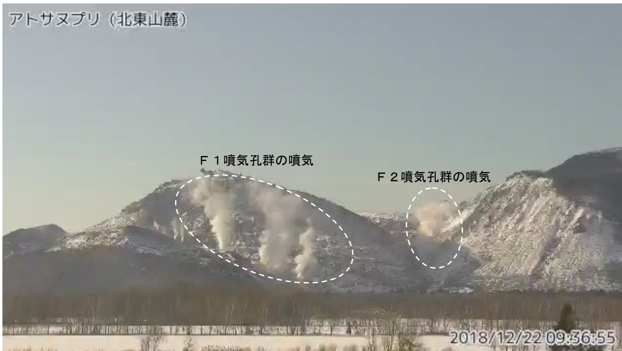
図2 アトサヌプリ 北東側から見た山体の状況 (12月22日、北東山麓監視カメラによる)