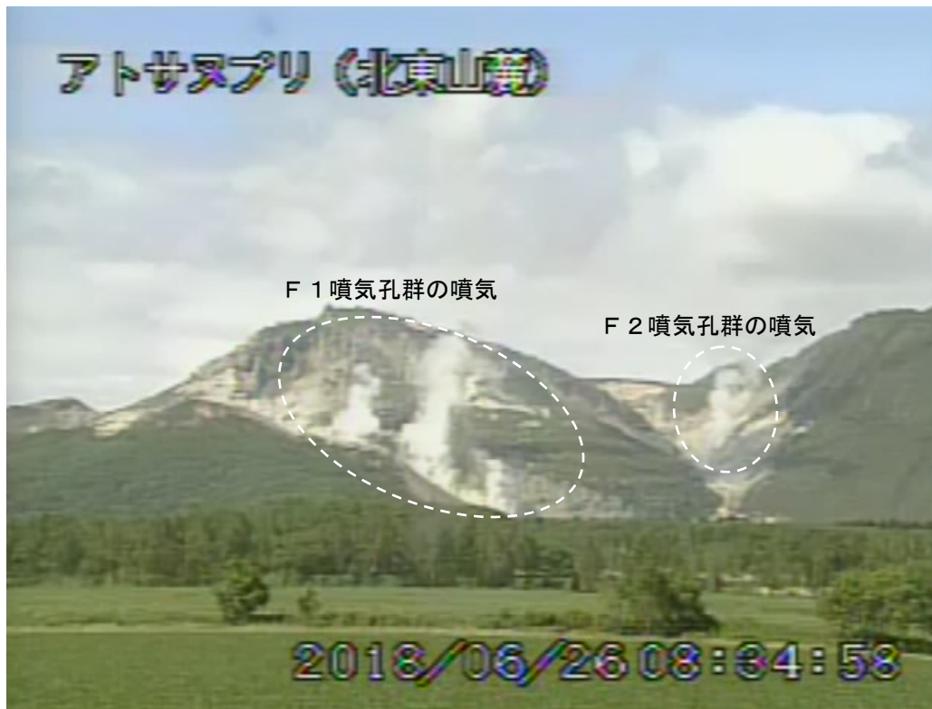
図2 アトサヌプリ 北東側から見た山体の状況 (6月26日、北東山麓監視カメラによる)