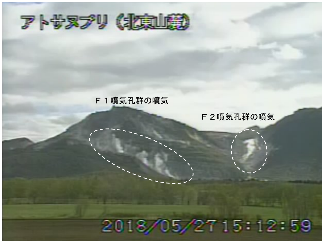
図2 アトサヌプリ 北東側から見た山体の状況 (5月27日、北東山麓監視カメラによる)